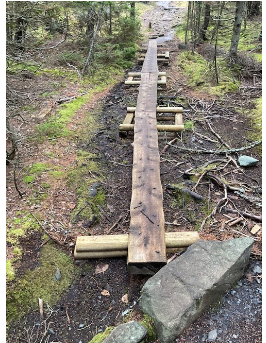
Un pont de tourbière, comme celui-ci dans le parc national d'Acadia, permet de traverser un terrain humide sans perturber le sol.

Réfléchissez aux personnes qui utiliseront le nouveau sentier. Les visiteurs seront-ils des individus isolés ou des personnes qui espèrent marcher côte à côte ? Peut-être des VTT ou des vélos emprunteront-ils ces sentiers ? Prévoyez la largeur, la pente et les interactions potentielles avec les dangers (comme les racines et les rochers !) en conséquence. Les randonneurs de la côte Est plaisantent parfois sur le fait que de nombreux sentiers classiques du Nord-Est empruntent un chemin agressivement direct qui monte directement sur une pente. Évitez de construire un sentier classique du nord-est, car non seulement cela fatigue le randonneur, mais cela peut aussi entraîner des problèmes d'érosion à long terme. Il est préférable de tracer le sentier sur un terrain plus doux, en créant des lacets et en ajoutant des barres d'eau pour réduire au minimum l'érosion par l'eau. Des tremplins ou des ponts de tourbière peuvent aider à traverser un terrain humide sans perturber le sol, mais veillez à respecter les réglementations locales. Une équipe peut être engagée pour construire ce nouvel ajout amusant à votre lot boisé, mais il est plus que probable que vous, vos amis et/ou votre famille travaillerez à ce travail. Prenez votre temps, soyez attentif et prudent, et amusez-vous !