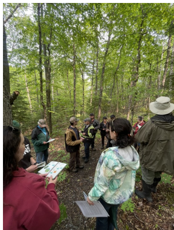
Photo: Session sur le terrain - Travail sur l'outil (de Laura MacKinnon)