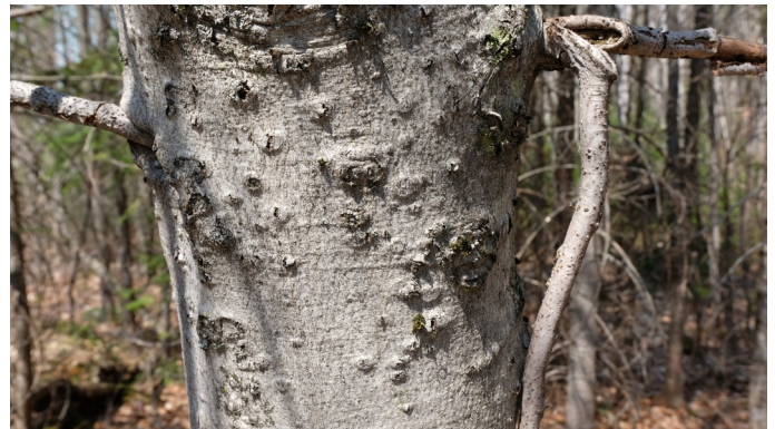
Photo: Hêtre à grandes feuilles touché par la maladie corticale du hêtre (de Diane Fargialla) Photo prise en mai sur le même site