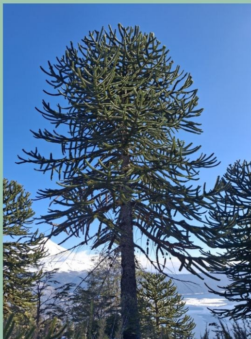
Désespoir des singes, Chili

Cela dit, ce conifère porte bien son nom avec sa silhouette singulière et ses feuilles épaisses et pointues en forme d'écailles densément imbriquées le long des branches, leur donnant un aspect reptilien. Pas étonnant qu'il soit l'arbre national du Chili !